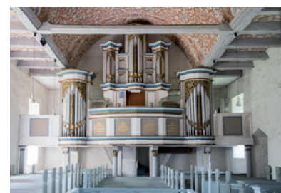
Orgel in Dallmin