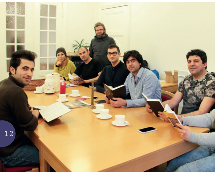
Die Mitglieder des Irankreises bei der Bibelarbeit.