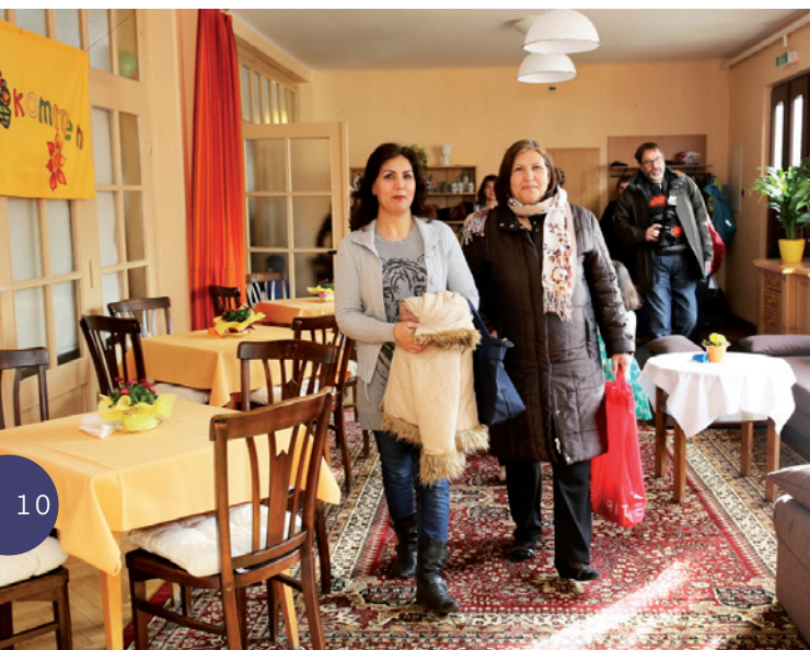
Das Sprachcafé im Wittenberger Gemeindehaus.